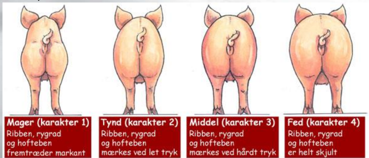
Figur 1. Huldvurdere søer. (Billededatabase 2255)